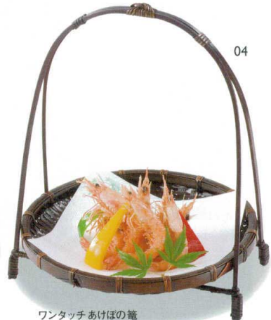
ワンタッチあけほの籠

14-126-03 (24983) 小 2,100円 約φ17×H21.5cm 14-126-04 (24984) 大 2,200円 約φ19×H23cm