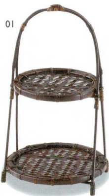
ワンタッチあけほの二段籠

14-126-01 (24985) 小 3,300円 約φ18(φ15)×H32cm 14-126-02 (24986) 大 3,600円 約φ21(φ18)×H32cm