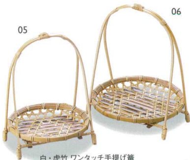
白・虎竹 ワンタッチ手提げ籠

14-126-05 (22388) 小 2,500円 約φ14×H21cm 14-126-06 (22389) 大 2,800円 約φ17×H22.5cm ※籠を取り外しできるので収納に便利です。