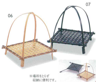
万葉ワンタッチ(小)

14-127-06 (024204) トラ竹 1,550円 約15×15×H17.5cm 14-127-07 (24208) 染 1,650円 約15×15×H17.5cm