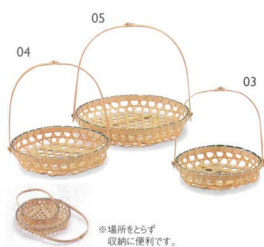
白竹手提籠(手折タイプ)

14-127-02 (22136) 大 1,350円 約φ18×H16.5(3.7)cm