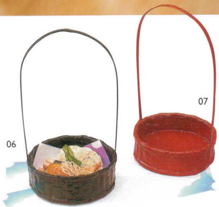
六ツ目手提籠 14-128-08 (24114) 晒 1,800円 約φ14.5×H18(3.8)cm 14-128-09 (24115) 染 1,950円 約φ14.5×H18(3.8)cm