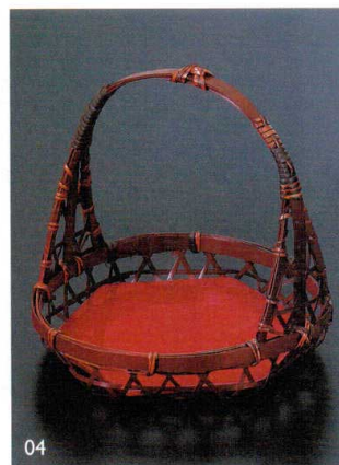
14-128-04 (24202) 手付盛籠 中(塗板付) 2,850円 約φ17×H16.5(3.8)cm