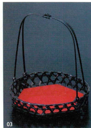
14-128-03 (24407) 万葉若葉籠(塗板付) 3,050円 約φ17×H20.5(4)cm