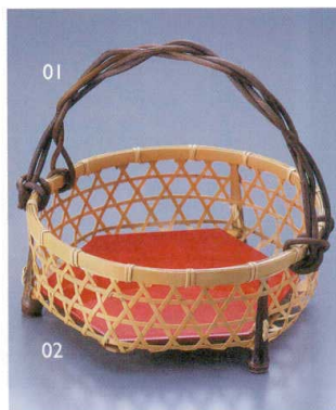
14-128-01 (22386) 六ツ目高台寺籠 3,700円 約φ21×H20(8)cm ※塗板別売