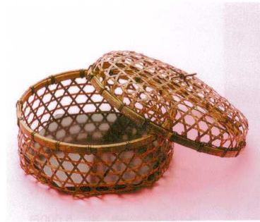
14-130-05 (23391) 虎竹六ツ目蓋物(黒溜板付) 7,300円 約φ20×H8cm(塗板:約15.2×17.5cm)/身:約φ18.5×H7cm