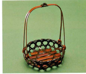
14-130-06 (22366) 柄付珍珠籠(黒) 1,450円 約φ12×H18(3.4)cm