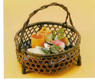
14-130-07 (22360) 虎竹六ツ目高台寺籠(板付) 7,500円 約φ21×H20(9)cm(塗板:約19×16.5cm)