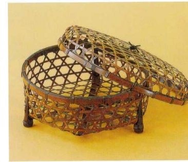
14-130-13 (23360) 高台寺蓋付籠 6,400円 約φ23×H9.5cm/身:約φ21×H8cm