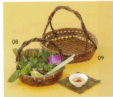
14-130-08 (23352) 淡路籠(小) 2,000円 約φ18×H16.5(4.7)cm