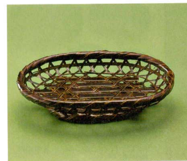
14-130-12 (23356) 塗り小判籠台付 1,250円 約19.5×14×H4.7cm