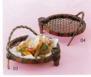
14-130-03 (23353) 山科籠(大) 3,400円 約φ17×H9(4)cm