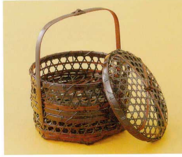
14-130-02 (22370) 柄付二段料理籠 12,500円 約φ23×H30cm/蓋約H5cm・上段約H9.3cm・下段約H7.5cm