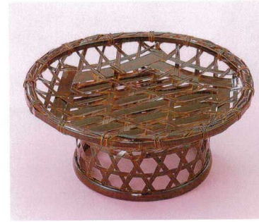
14-130-10 (24023) 塗り六ツ目高台皿 1,700円 約φ19.5×H8cm