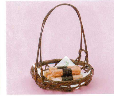
14-130-14 (23355) 塗り露草籠 650円 約φ12×H14.5(2.6)cm