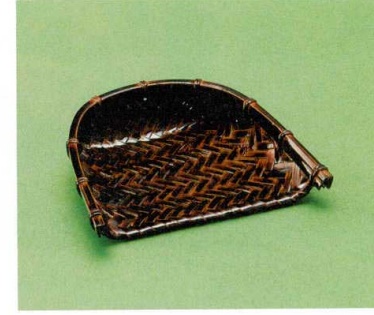
14-130-11 (38016) 塗りアジロ箕(小) 700円 約11.2×10×H3.2cm