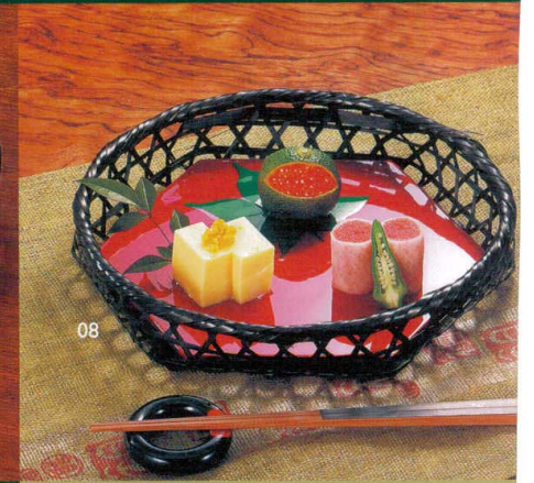
14-132-08 (24205) 手なし盛籠(塗板付) 3,300円 約φ19.5×H4cm/塗板対辺:約16cm