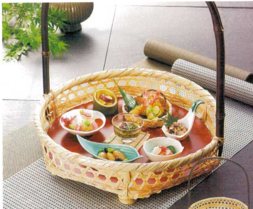
黒竹手堤・望月籠 ※丸塗板別売です。 14-132-01 (23418) 尺二 8,500円 約φ36×H41cm 14-132-02 (23419) 尺三 10,000円 約φ39×H44cm 14-132-03 (23420) 尺四 11,500円 約φ42×H47cm ※丸塗板はP133を参照ください。※小鉢・コースター別売。