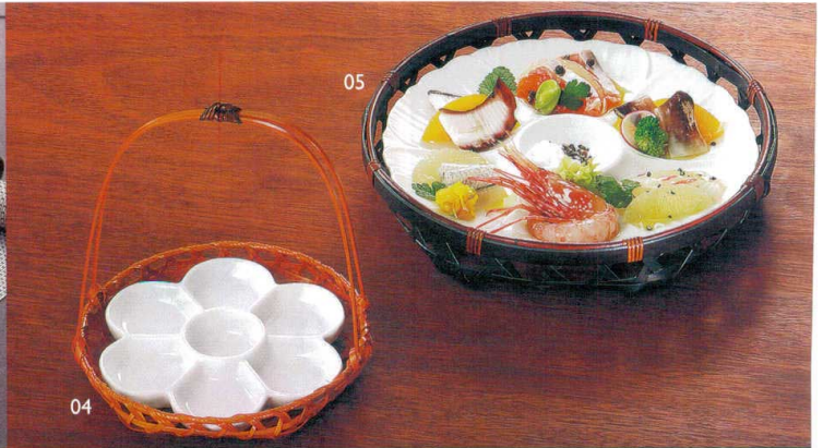
14-132-04 (24932) 菌染手付ミニオードブル皿 (籠・陶器セット) 3,100円 籠:約φ17×H20.5(2.8)cm/陶器:約φ15.3×H1.8cm