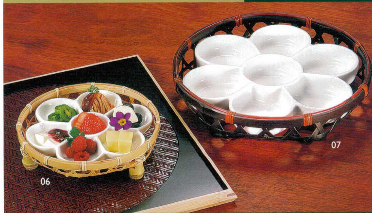
14-132-06 (24930) 白竹足付ミニオードブル皿 (籠・陶器セット) 2,900円 籠:約φ17×H4.5cm/陶器:約φ15.3×H1.8cm