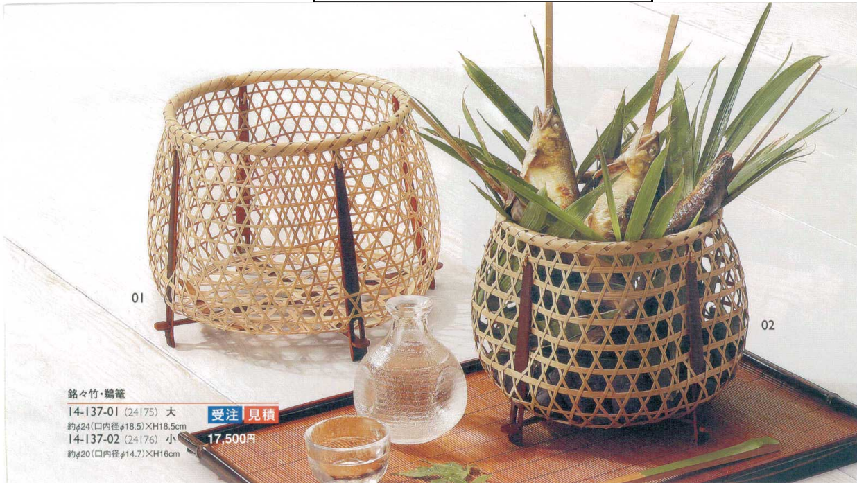
銘々竹・鶺籠 14-137-01 (24175) 大 受注 見積 17,500円 約φ24(口内径φ18.5)×H18.5cm 14-137-02 (24176) 小 約φ20(口内径φ14.7)×H16cm