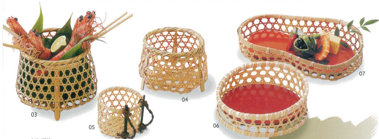
白竹・鶺籠 14-137-03 (22120) 大 3,100円 約φ15(口内径φ10.7)×H11cm 14-137-04 (22121) 小 2,650円 約φ12.5(口内径φ9.5)×H9cm