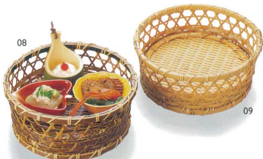
ミニオードブル籠 14-137-08 (22385) 虎竹 2,400円 約φ18×H7.5cm 14-137-09 (22384) 白竹 2,250円 約φ18×H7.5cm ※底板(約φ15.5cm)取り外し式 ※小鉢はイメージ