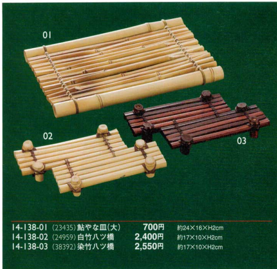
14-138-01 (23435) 鮎やな皿(大) 700円 約24×16×H2cm 14-138-02 (24959) 白竹ハツ橋 2,400円 約17×10×H2cm 14-138-03 (38392) 染竹ハツ橋 2,550円 約17×10×H2cm