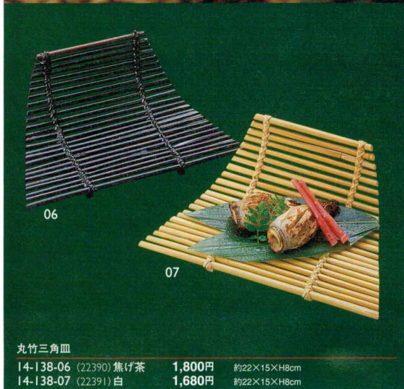
丸竹三角皿 14-138-06 (22390) 焦げ茶 1,800円 約22×15×H8cm 14-138-07 (22391) 白 1,680円 約22×15×H8cm