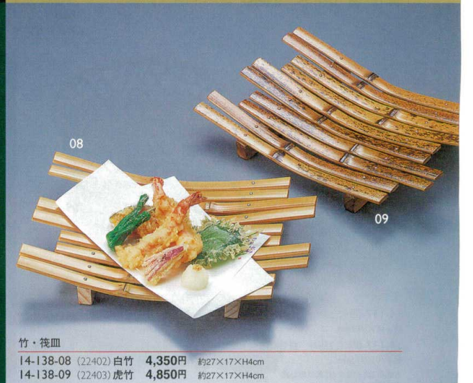
竹・筏皿 14-138-08 (22402) 白竹 4,350円 約27×17×H4cm 14-138-09 (22403) 虎竹 4,850円 約27×17×H4cm