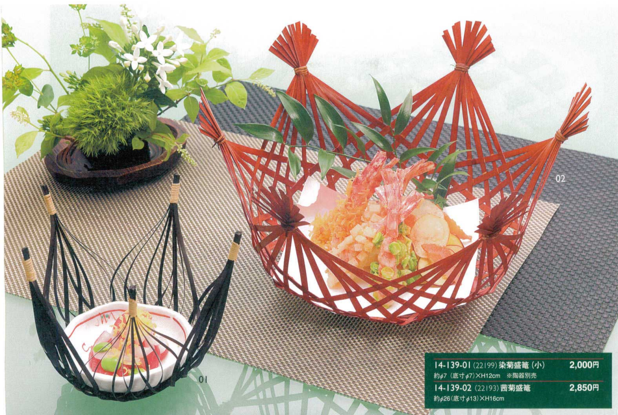
14-139-01 (22199) 染菊盛籠(小) 2,000円 約φ7(底寸φ7)×H12cm ※陶器別売 14-139-02 (22193) 茜菊盛籠 2,850円 約φ26(底寸φ19)×H16cm