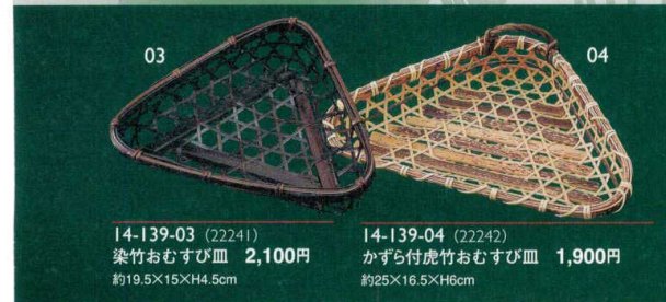
14-139-03 (22241) 染竹おむすび皿 2,100円 約19.5×15×H4.5cm 14-139-04 (22242) かずら付虎竹おむすび皿 1,900円 約25×16.5×H6cm