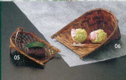
14-139-05 (22349) 虎竹四つ目長箕手付 1,150円 約9.3×14.3×H7.5cm 14-139-06 (22348) 虎竹半皮吹き寄せ皿 4,450円 約15.8×18.5×H8.3cm