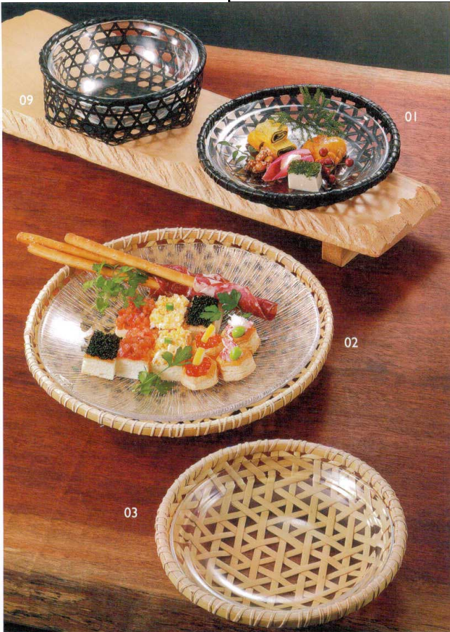
14-142-01 (24712) 染竹・オードブル皿(中) 5,700円 約φ21×H3.5cm ※ガラス付 14-142-02 (24978) 白竹・オードブル皿(大) 9,200円 約φ30×H4.5cm ※ガラス付 14-142-03 (24713) 白竹・オードブル皿(小) 5,600円 約φ21×H3.5cm ※ガラス付