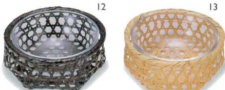
14-142-12 (24706) 染竹・サラダ小鉢 2,800円 約φ14×H5.5cm ※ガラス付 14-142-13 (24707) 白竹・サラダ小鉢 2,700円 約φ14×H5.5cm ※ガラス付