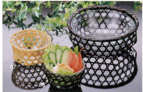
14-142-07 (24409) 白竹・小鉢(ガラス付) 1,200円 約φ10×H4.5cm 14-142-08 (24408) 染竹・小鉢(ガラス付) 1,200円 約φ10×H4.5cm 14-142-09 (24410) 染竹・中鉢(ガラス付) 3,500円 約φ18.5×H7cm