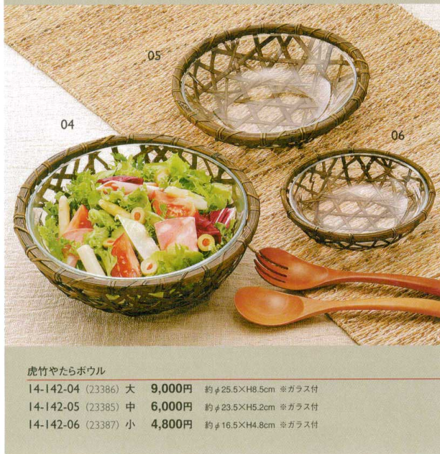
虎竹やたらボウル 14-142-04 (23386) 大 9,000円 約φ25.5×H8.5cm ※ガラス付 14-142-05 (23385) 中 6,000円 約φ23.5×H5.2cm ※ガラス付 14-142-06 (23387) 小 4,800円 約φ16.5×H4.8cm ※ガラス付