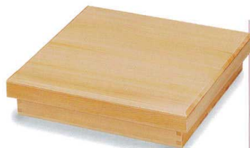
14-152-03 (29101) 檜・松花堂弁当 8,350円 約27.2×27.2×H6.5cm 内寸約24×24×H5cm (1樹内寸約11.6×11.6cm/ 仕切約H4.2cm) (29102) 身 4,600円 約25.7×25.7×H5.5cm (29103) 蓋 2,900円 (29104) 十字仕切のみ 850円