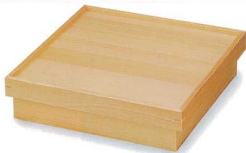
14-152-02 (27291) 積重 檜・松花堂弁当 (重ね蓋) 8,500円 約27.5×27.5×H6.5cm 内寸約24×24×H5cm (1樹内寸約11.6×11.6cm/ 仕切約H4.2cm)