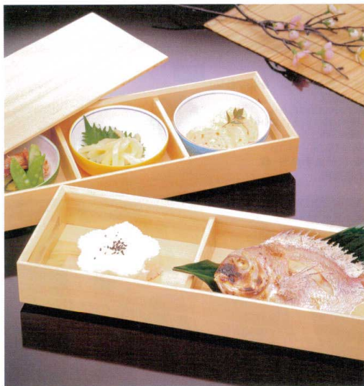
14-156-03 (29603) 檜・二段長手弁当 13,800円 約37.5×13.2×H11.8cm 一段約37.5×13.2×H5.5cm (29611) 蓋 2,400円 (29612) 身(2ツ仕切) 5,550円 大樹内寸約20.2×11.7×H4.8cm 小樹内寸約15.5×11.7×H4.8cm (29613) 身(3ツ仕切) 5,850円 1樹内寸約11.7×11.7×H4.8cm