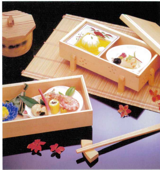
14-156-02 (27111) 受注 檜・二段重ね弁当 11,500円 約25.2×13.2×H12.7cm 一段(足なし)約24×12.5×H5.1cm (足付)約H7.1cm 内寸約22.5×11.3×H4.3cm