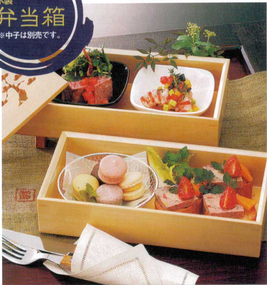
14-156-01 (27146) 檜・松風二段弁当 10,000円 約24×12.8×H12.5cm 内寸約22.5×11.2×H4.2cm