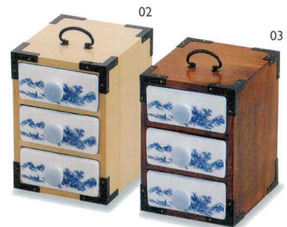
14-166-02 (27020) 三段弁当(白木) 10,800円 約11.3×13×H16.3cm/1段内寸約7.2×11.4×H2.8cm 14-166-03 (27021) 三段弁当(古代色) 11,000円 約11.3×13×H16.3cm/1段内寸約7.2×11.4×H2.8cm ※引出し(陶器)×3ヶ付