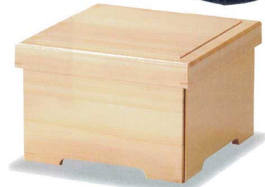
14-166-01 (27176) 檜・開き二段弁当 15,000円 約21×21×H13.5cm/上段1柵内寸約7.9×7.9×H4.4cm /下段内寸約16×16×H4.4cm