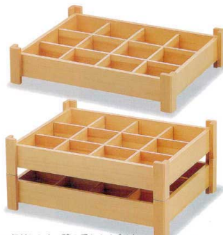
※収納しやすい積み重ねタイプです。 14-168-01 (27164) 積重 白木隅足十二仕切盛込 12,500円 約35×26.7×H8.5cm/1柵内寸約7.7×7.7cm