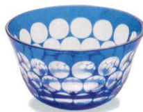
14-168-06 (25695) 硝子小鉢(ルリ) 700円 約φ7.1×H3.8cm