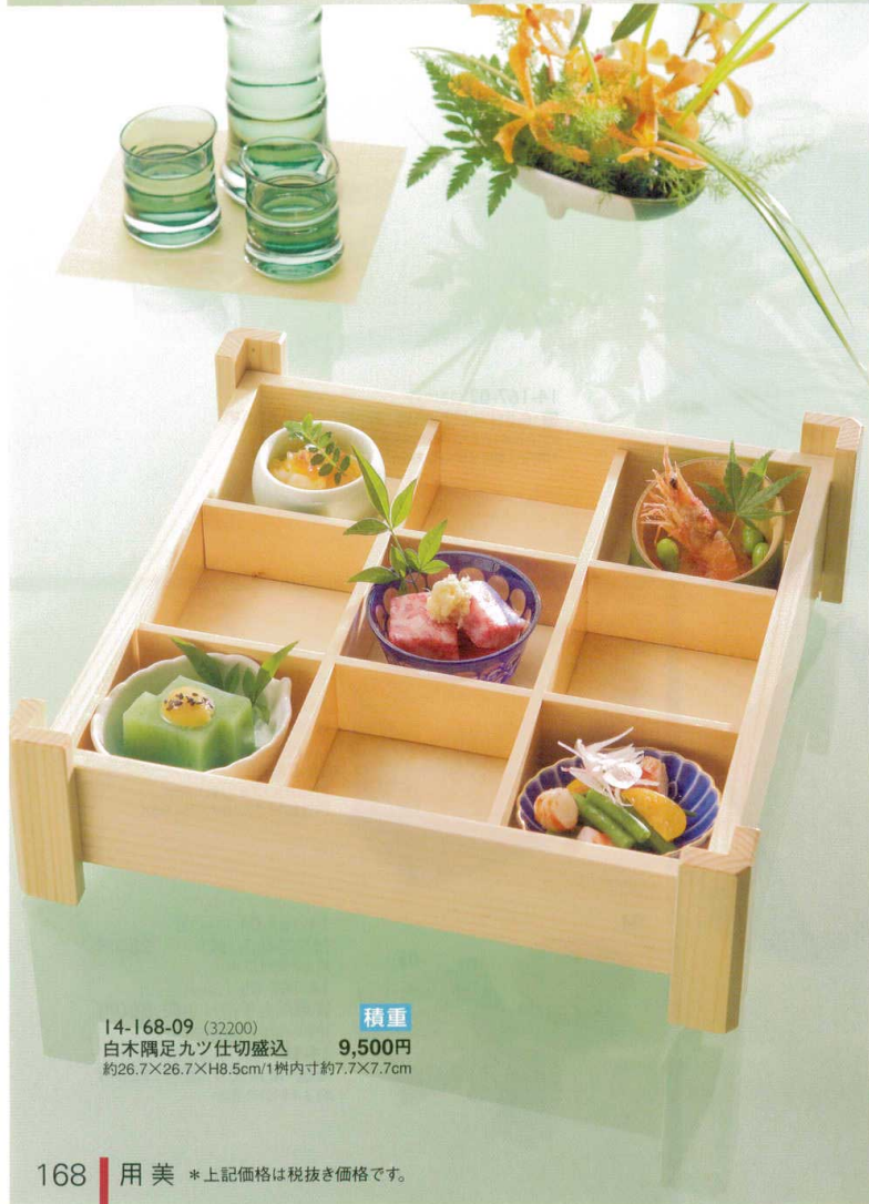
14-168-09 (32200) 積重 白木隅足九ツ仕切盛込 9,500円 約26.7×26.7×H8.5cm/1柵内寸約7.7×7.7cm