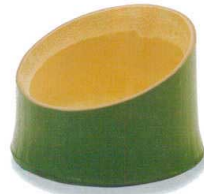
14-168-05 (22376) 若竹ハス切珍味入 900円 約φ6.5×H4.5(2.5)cm