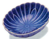
14-168-08 (26386) 小判型菊皿(ルリ) 430円 約7.7×6.1×H2.5cm