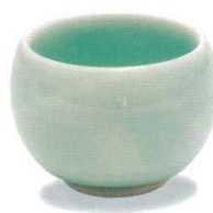
14-168-04 (26572) 青磁珍味入 380円 約φ5.3×H4cm