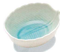
14-168-07 (26575) 木の葉珍味入 青流し 380円 約8×6.7×H3cm