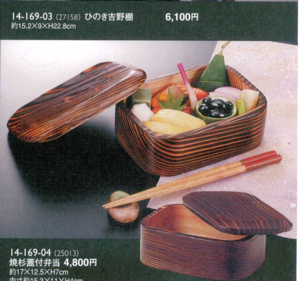
14-169-04 (25013) 焼杉蓋付弁当 4,800円 約17×12.5×H7cm 内寸約15.3×11×H4cm