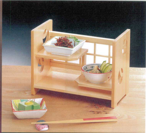
14-169-02 (27031) 白木段違い料理棚(障子) つぼつぼ 11,000円 約24.5×13×H18.6cm/棚一段約11.7×10.4cm