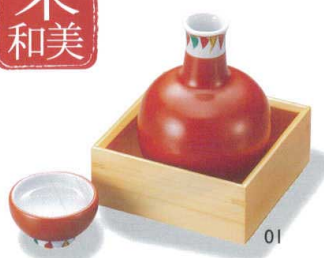
14-172-01 (27064) 木和美・正角料理箱(身) 800円 約10.7×10.7×H4.8cm/内寸約9.4×9.4×H4cm ※酒器・杯はイメージ