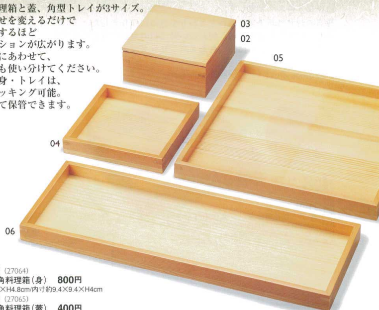
14-172-02 (27064) 木和美・正角料理箱(身) 800円 約10.7×10.7×H4.8cm/内寸約9.4×9.4×H4cm 14-172-03 (27065) 木和美・正角料理箱(蓋) 400円 約10.7×10.7×H1cm 14-172-04 (27066) 木和美・正角トレイ(小) 600円 約12.2×12.2×H2cm/内寸約10.7×10.7×H1.3cm

四角い料理箱と蓋、角型トレイが3サイズ。組み合わせをえるだけでびっくりするほどバリエーションが広がります。メニューにあわせて、何通りにも使い分けてください。料理箱の身・トレイは、全てスタッキング可能。積み重ねて保管できます。