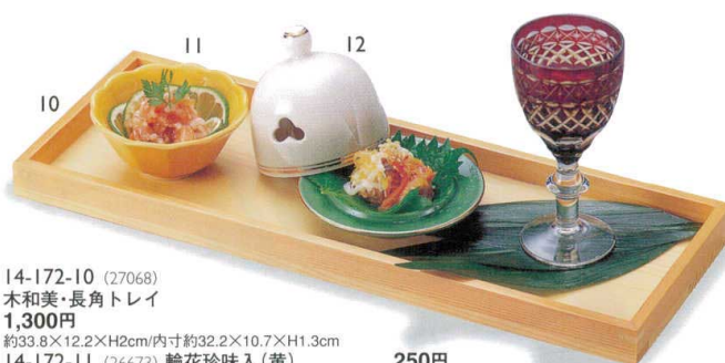
14-172-10 (27068) 木和美・長角トレイ 1,300円 約33.8×12.2×H2cm/内寸約32.2×10.7×H1.3cm 14-172-11 (26673) 輪花珍珠入(黄) 250円 約φ7.9×H3.4cm 14-172-12 (26620) 透かし蓋珍珠皿(ヒワ吹) 450円 約φ9×H8cm ※グラスはイメージ