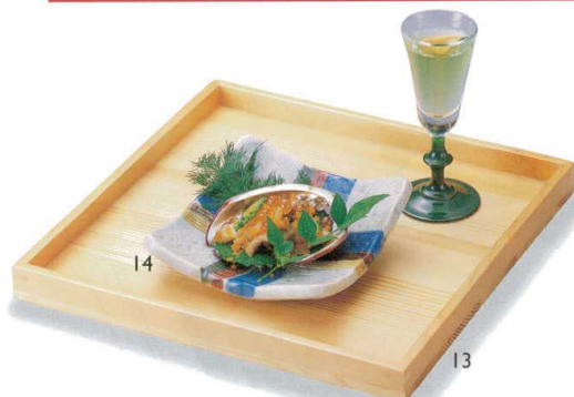
14-172-13 (27067) 木和美・正角トレイ(大) 1,500円 約23×23×H2cm/内寸約21.6×21.6×H1.3cm 14-172-14 (26645) 糸引き皿 1,200円 約11×11×H3cm ※グラスはイメージ