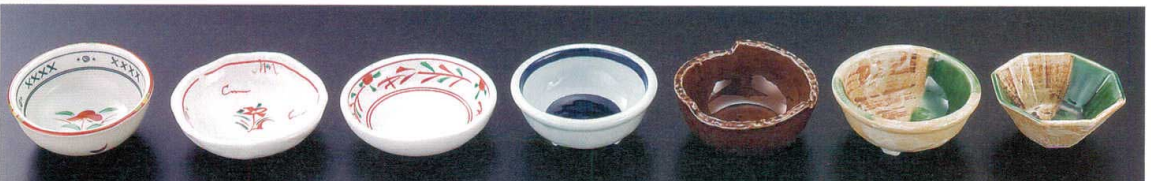
点字赤繪花千代口 14-179-28 (25030) 540円 約φ9×H3.5cm 手描朱呉須花繪豆皿 14-179-29 (26555) 760円 約φ9.3×H2.8cm 赤繪小皿 14-179-30 (25509) 670円 約φ9.3×H3cm 呉須丸紋ミツ足千代口 14-179-31 (26636) 550円 約φ9×H3.5cm アメ細三ツ切小付 14-179-32 (26638) 400円 約φ8.7×H4cm 織部志野ミツ足千代口 14-179-33 (26637) 600円 約φ9×H3.5cm 織部志野八角小付 14-179-34 (26639) 480円 約φ8.2×H3.3cm