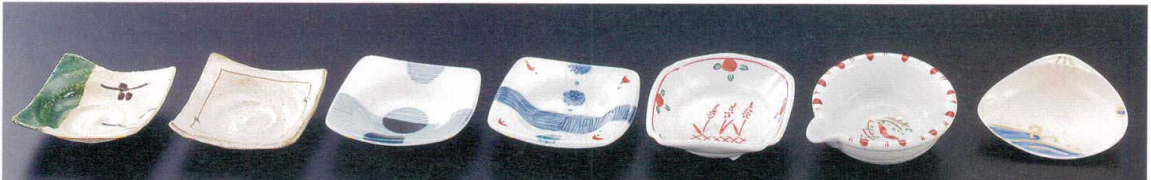
青織部角手造り小皿 14-179-14 (26641) 580円 約8.5×8.5×H2.5cm 白線縁ちまり角小皿 14-179-15 (25029) 570円 約8.5×8.5×H2.5cm 藍丸紋角小付 14-179-16 (26642) 300円 約9.2×9.2×H2.3cm 赤繪角小付 14-179-17 (26643) 400円 約9.2×9.2×H2.3cm 手描赤繪角小皿 14-179-18 (26517) 880円 約9.3×9.3×H2.8cm 手描柳紋片口小付 14-179-19 (26618) 880円 約10.6×9.3×H3.5cm 高来流水小皿 14-179-20 (25514) 850円 約9.5×7.5×H2cm