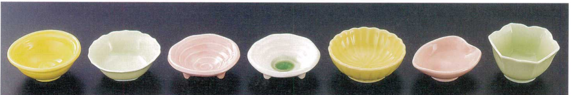
玉濁小付 (イエロー) 14-179-21 (26631) 400円 約φ8.6×H3.5cm 桔梗型小付 (ヒワ) 14-179-22 (26632) 380円 約φ8.8×H3.2cm ミツ足姫小付 (ピンク) 14-179-23 (26634) 360円 約φ8.8×H2.8cm ミツ足姫小付 (ヒワボカシ) 14-179-24 (26635) 360円 約φ8.8×H2.8cm 黄八重菊千代久 14-179-25 (26532) 480円 約φ9.2×H3.3cm 桜姫小付 (ピンク) 14-179-26 (26630) 360円 約8.5×7×H3cm 六角桔梗型小付 (ヒワ) 14-179-27 (26633) 380円 約φ8.5×H4.5cm