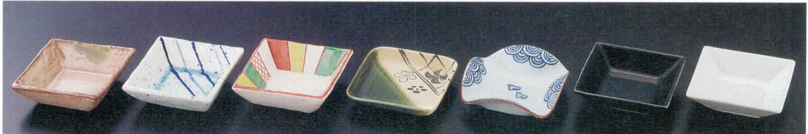
山風角小皿 14-179-07 (25026) 380円 約8.8×8.8×H2.7cm 潮花角小皿 14-179-08 (25025) 380円 約8.8×8.8×H2.7cm 紙風船角千代口 14-179-09 (25027) 980円 約8.8×8.8×H2.7cm 織部梅角小皿 14-179-10 (25028) 350円 約8.8×8.8×H1.7cm 手描波千鳥四方波小皿 14-179-11 (26547) 500円 約9.3×9.3×H2.8cm ブラック角皿 (中) 14-179-12 (26661) 430円 約8.7×8.7×H2.7cm ホワイト角皿 (中) 14-179-13 (26662) 430円 約8.7×8.7×H2.7cm