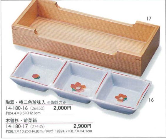
陶器・椿三色珍珠入 ※陶器のみ 14-180-16 (26650) 2,000円 約24.4×8.5×H2.6cm 木曾杉・前菜箱 14-180-17 (27435) 2,900円 約26.1×10.2×H4.8cm/内寸:約24.7×8.7×H4.1cm