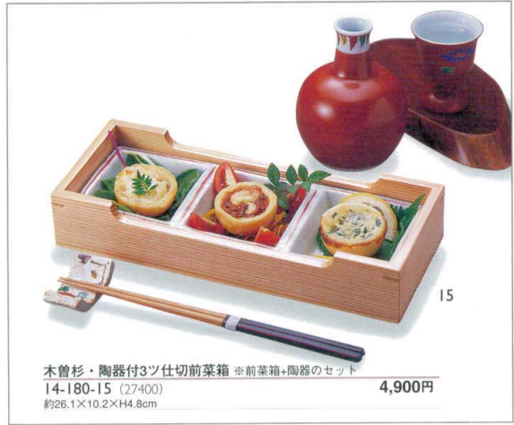
木曾杉・陶器付3ツ仕切前菜箱 ※前菜箱・陶器のセット 14-180-15 (27400) 4,900円 約26.1×10.2×H4.8cm