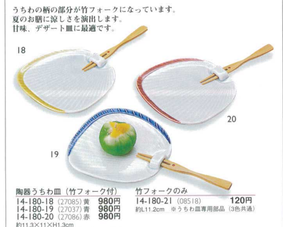
うちわの柄の部分が竹フォークになっています。夏のお膳に涼しさを演出します。甘味、デザート皿に最適です。 18 陶器うちわ皿(竹フォーク付) 14-180-18 (27085) 黄 980円 14-180-19 (27037) 青 980円 14-180-20 (27086) 赤 980円 約11.3×11×H1.3cm 20 竹フォークのみ 14-180-21 (08518) 120円 約L11.2cm ※うちわ皿専用部品 (3色共通)