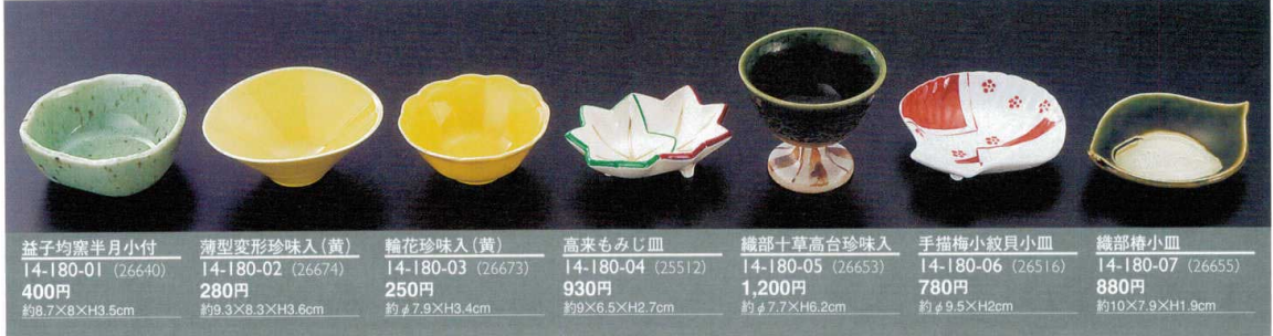
益子均潔半月小付 14-180-01 (26640) 400円 約8.7×8×H3.5cm 薄型変形珍珠入(黄) 14-180-02 (26674) 280円 約9.3×8.3×H3.6cm 輪花珍珠入(黄) 14-180-03 (26673) 250円 約7.9×H3.4cm 高来もみじ皿 14-180-04 (25512) 930円 約9×6.5×H2.7cm 織部十草高台珍珠入 14-180-05 (26653) 1,200円 約7.7×H6.2cm 手描梅小紋貝小皿 14-180-06 (26516) 780円 約9.5×H2cm 織部椿小皿 14-180-07 (26655) 880円 約10×7.9×H1.9cm

中子 ミニサイズ | 1柵内寸が9.4×9.4cm以上のものにお使いいただけます。