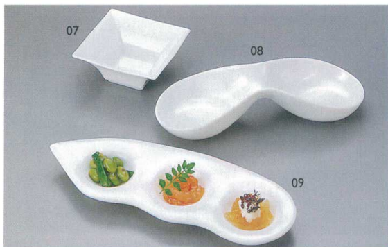
白磁・漣 (りん) 14-183-07 (32267) 角小鉢 550円 約8.7×9.7×H4.3cm 14-183-08 (32268) プリッジ 1,750円 約21.5×8×H5cm 14-183-09 (32269) そら豆 660円 約24.5×9×H2.4cm