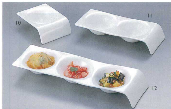
白磁・ディンプル (えくぼ) 14-183-10 (32270) I 700円 約11×8×H3cm 14-183-11 (32271) II 1,000円 約18×8×H3cm 14-183-12 (32272) III 1,300円 約26×8×H3cm