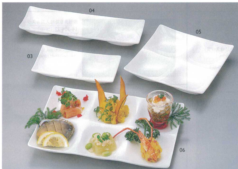
白磁・漣 (りん) 14-183-03 (32263) 二つ仕切り 700円 14-183-05 (32265) 与つ仕切り 1,250円 約16.5×8.5×H2.9cm 約17.1×17.1×H2.9cm 14-183-04 (32264) 三つ仕切り 1,050円 14-183-06 (32266) 六つ仕切り 1,750円 約25.8×8.5×H2.9cm 約25.7×17.1×H2.9cm ※ガラスはイメージ