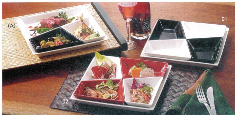
カレントオードブル皿セット 14-183-01 (24268) 白黒 8,600円 14-183-02 (24269) 紅白 8,800円 四方皿：約25.5×25.5×H2.7cm 台形小皿：約15.5×12×H3.1cm 四方皿：約25.5×25.5×H2.7cm 台形小皿：約15.5×12×H3.1cm ※写真中の長角皿(A)は、別途お問い合わせください。