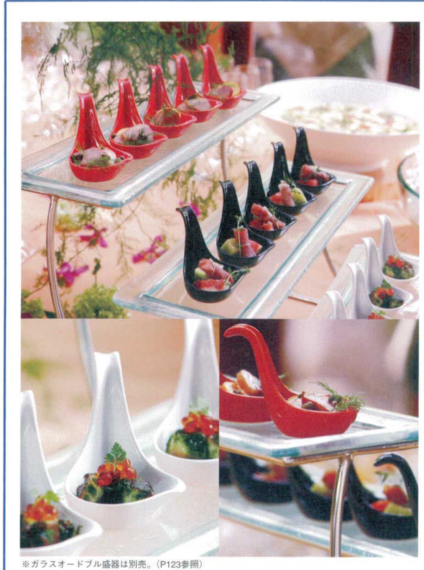
※ガラスオードブル盛器は別売。(P123参照)