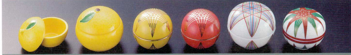
陶器・新ゆず珍味入(小) 14-190-20 (25309) 750円 約φ4.9×H4.5cm 蓋付ゆず珍味入(中) 14-190-21 (26303) 800円 約φ6.5×H5.3cm 手まり珍味入(黄) 14-190-22 (26342) 1,200円 約φ5.3×H4.8cm 手まり珍味入(赤) 14-190-23 (26339) 1,200円 約φ5.3×H4.8cm 友禅千筋手まり珍味入 14-190-24 (25529) 1,650円 約φ6.2×H6cm 京風手毬珍味入 14-190-25 (26360) 1,850円 約φ5.7×H4.8cm