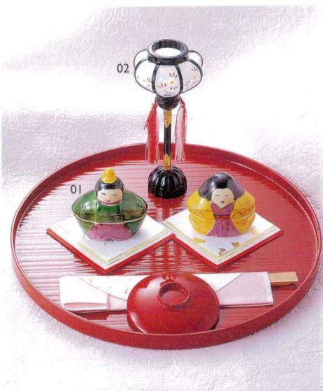
陶器・おひな様珍味入セット(一組)(陶器のみ)※バラ売り不可 14-190-01 (25401) 3,900円 内蓋 約8.5×4.8×H9.3cm / 蓋 約8×4.7×H7.8cm 飾りぼんぼり(一個) 14-190-02 (64170) 3,500円 約H19cm