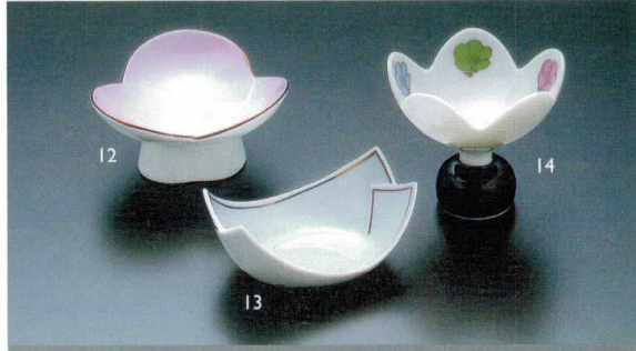
14-190-12 (25774) 測金ピンク三つ葉小鉢 1,450円 約φ8.4×H3.8cm 14-190-13 (25773) 赤金測錐舟小鉢 1,100円 約8.2×6.6×H3.4cm 14-190-14 (25775) 赤羽根型小付 1,450円 約φ7.2×H6.2cm