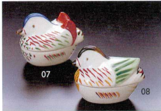
おしどり珍味入(オス) 14-190-07 (25395) 2,300円 約8×4.9×H6cm おしどり珍味入(メス) 14-190-08 (25394) 2,300円 約8×4.9×H6cm