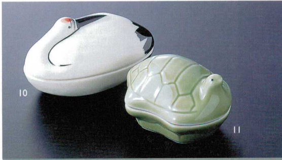
14-190-10 (25426) 陶器・鶴型珍味入 1,600円 約10×5.4×H5.5cm 14-190-11 (26341) 陶器・亀型珍味入 1,400円 約8×5.8×H5cm