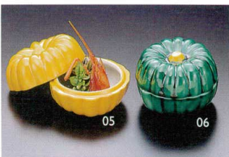
南瓜珍味入(黄) 14-190-05 (26358) 1,950円 約φ6×H4.1cm 南瓜珍味入(緑) 14-190-06 (26357) 1,950円 約φ6×H4.1cm