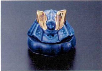
かぶと珍味入 14-190-09 (25402) 1,400円 約φ5.8×H5cm