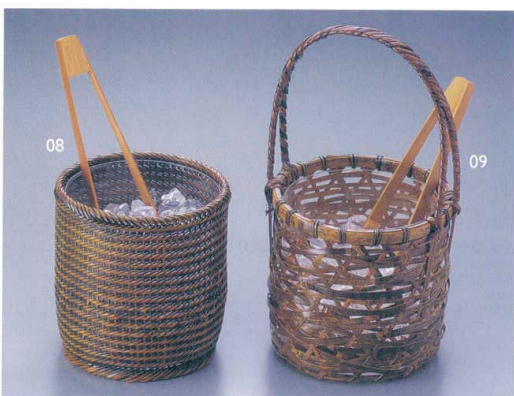
14-197-08 (12377) 溜壁峨野アイスベール(トング付) 14,800円 約φ13×H13.5cm/トング約L16cm 14-196-09 (22362) 虎竹やたら編アイスベール(トング付) 12,500円 約φ14×H24(13)cm/トング約L18.3cm