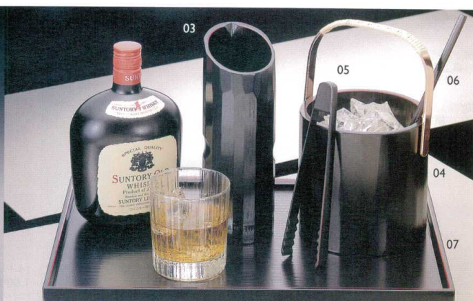
14-197-03 (24548) 黒塗水差し(ピッチャー) 2,150円 約φ7.5×H21cm 14-197-04 (24549) 黒塗氷入れ(アイスベール) 5,800円 約φ13×H13cm 14-197-05 (24550) 黒塗アイストング 1,200円 約L18cm 14-197-06 (24551) 黒塗マドラー 850円 約L21.8cm 14-197-07 (24552) 黒塗通い盆 6,700円 約39×27×H1.9cm