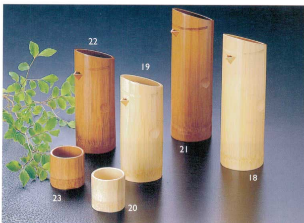
14-197-18 (12130) 白竹くちばし德利 約2合 2,300円 約φ6.8×H21cm 14-197-19 (12131) 白竹くちばし德利 約1合 2,150円 約φ6.5×H16cm 14-197-20 (12340) 白竹ぐいのみ 1,550円 約φ4.7×H5cm 14-197-21 (12133) すず竹くちばし德利 約2合 2,300円 約φ6.8×H21cm 14-197-22 (12134) すず竹くちばし德利 約1合 2,150円 約φ6.5×H16cm 14-197-23 (12135) 煤竹ぐいのみ 1,100円 約φ5×H5cm