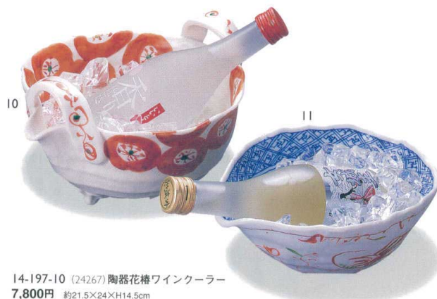
14-197-10 (24267) 陶器花椿ワインクーラー 7,800円 約21.5×24×H14.5cm 14-197-11 (12371) 花鳥椿片口ワインクーラー 5,800円 約19.5×17.8×H9cm