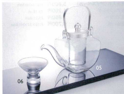
14-198-05 (24754) 硝子・角ちろり (シルバー) 15,000円 約16×9×H16(13)cm ※約450ml ※直火使用不可 14-198-06 (24755) 硝子・高台杯 1,950円 約φ7.5×H5cm ※約50ml