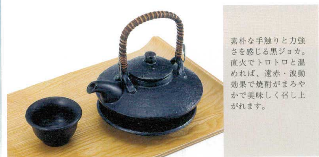
14-198-07 (85620) 遠赤・波動 黒ジョカ揃 7,250円 ジョカ：約18×15.5×H9cm (約400ml) 丸杯：約φ8×H4.5cm (約70ml) 敷皿：約φ14×H2.5cm ※ジョカと丸杯と敷皿のセットです。

素朴な手触りと力強さを感じる黒ジョカ。直火でトロトロと温めれば、遠赤・波動効果で焼酎がまるやかで美味しく召し上がれます。