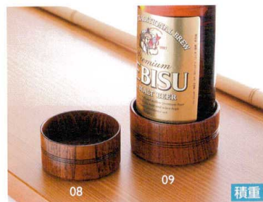
14-198-08 (16360) 樽風・徳利ハカマ 700円 約φ7.7×H3.8cm 14-198-09 (16361) 樽風・ビールハカマ 850円 約φ8.8×H4.6cm 内寸約φ8.3×H3.2cm