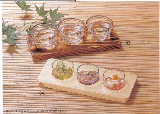
14-198-03 (16228) 利き酒トレイ(焼杉) 1,600円 約22×9×H1.5cm ※穴：約φ5.2(底φ5)×深さ0.6cm 14-198-04 (16229) 利き酒トレイ(白木) 1,950円 約22×9×H1.5cm ※穴：約φ5(底φ4.5)×深さ0.6cm