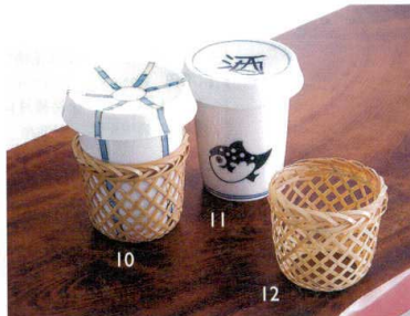
14-198-10 (12138) ひれ酒用酒器 (十草) 1,100円 約φ8×H9.3cm ※約150ml ※カバー別売 14-198-11 (12139) ひれ酒用酒器 (ふぐ) 980円 約φ8×H9.3cm ※約150ml ※カバー別売 14-198-12 (23425) ひれ酒カバー 900円 約φ7.3×H6.3cm

素朴な手触りと力強さを感じる黒ジョカ。直火でトロトロと温めれば、遠赤・波動効果で焼酎がまるやかで美味しく召し上がれます。