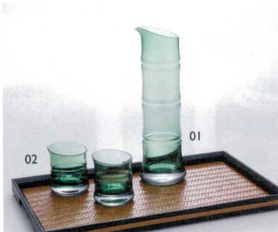
14-198-01 (24757) 硝子・竹型徳利 (グリーン) 4,500円 約φ4.6×H20cm ※約270ml 14-198-02 (24756) 硝子・竹型ぐい呑み (グリーン) 2,250円 約φ4.8×H5.8cm ※約48ml ※1個