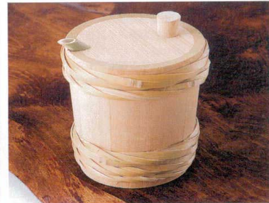
14-198-13 (12307) 椀・平椀 (1.5合) 7,000円 約φ10.3×H10.5cm ※無塗装