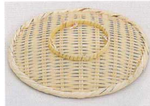
※24950・24951の足は写真のようになっています。