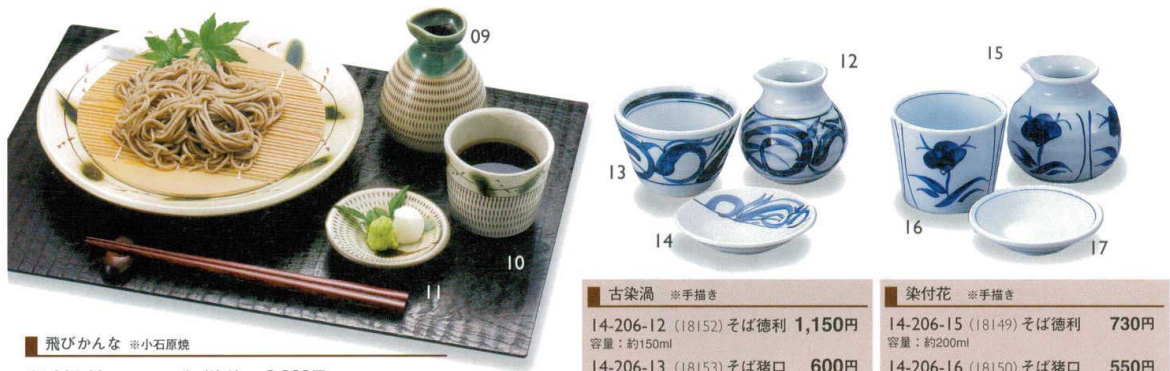
飛びかな ※小石原焼 14-206-09 (18163) そば徳利 3,000円 容量 約200ml 14-206-10 (18164) そば猪口 2,200円 約φ8×H7cm 14-206-11 (18165) 薬味皿 880円 約φ9×H2cm