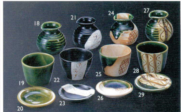
総織部 14-206-18 (18137) そば徳利 1,550円 容量：約170ml 14-206-19 (18138) そば猪口 1,250円 約φ8×H6cm 14-206-20 (18139) 薬味皿 850円 約φ9×H1.6cm 織部志野 14-206-24 (18143) そば徳利 1,550円 容量：約170ml 14-206-25 (18144) そば猪口 1,250円 約φ8×H6cm 14-206-26 (18145) 薬味皿 850円 約φ9×H1.6cm 黒織部 14-206-21 (18140) そば徳利 1,550円 容量：約170ml 14-206-22 (18141) そば猪口 1,250円 約φ8.5×H6cm 14-206-23 (18142) 薬味皿 850円 約φ9×H1.6cm 絵織部 ※手描き 14-206-27 (18146) そば徳利 1,650円 容量：約170ml 14-206-28 (18147) そば猪口 1,300円 約φ8×H6cm 14-206-29 (18148) 薬味皿 900円 約φ9×H1.6cm