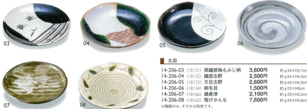
丸皿 14-206-03 (18131) 黒織部梅もみじ柄 3,600円 約φ24×H3.7cm 14-206-04 (18132) 織部志野 2,500円 約φ24×H4.5cm 14-206-05 (18133) 天目志野 2,600円 約φ24×H4.5cm 14-206-06 (18134) 刷毛目 1,500円 約φ23×H5cm 14-206-07 (18166) 錆唐津 2,100円 約φ23×H3.2cm 14-206-08 (18162) 飛びかな 7,600円 約φ24×H3.8cm ※陶器のみ、すだれは別売です。