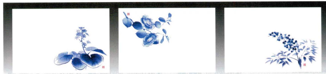
14-244-13(66340) 石菫(10月～11月) つわぶき