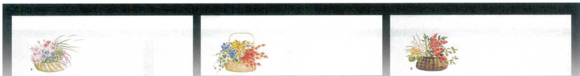
14-253-06(65535) 仲秋(9月~10月) (萩・すすき・こすもす・なでしこ・野菊)