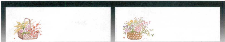
14-253-01(65530) 早春(1月~3月) (梅・片栗・れんぎょう・ねこやなぎ・さるとりいばら)