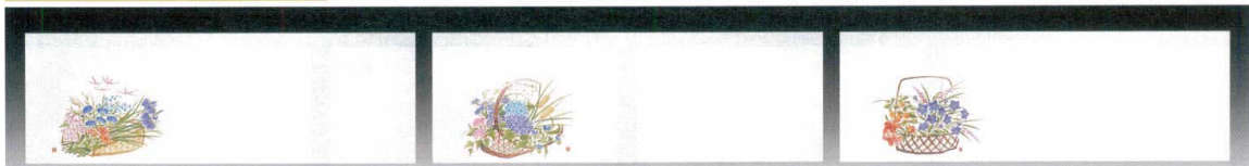
14-253-03(65532) 初夏(4月~5月) (菖蒲・きんせんか・矢車草・京かのこ・花大根・あぜすげ・忘れなぐさ)