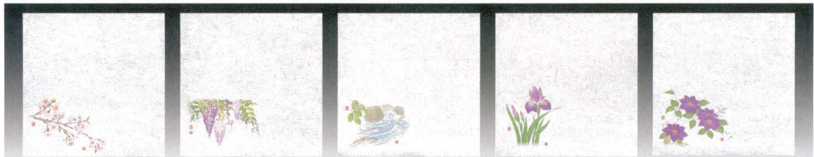
14-255-03 (65392) 桜 (3月～4月)