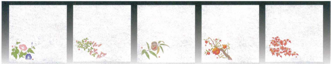
14-255-13 (65402) 朝顔 (7月～8月)