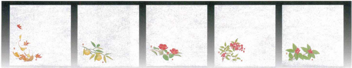
14-255-18 (65407) 落葉 (10月～12月)