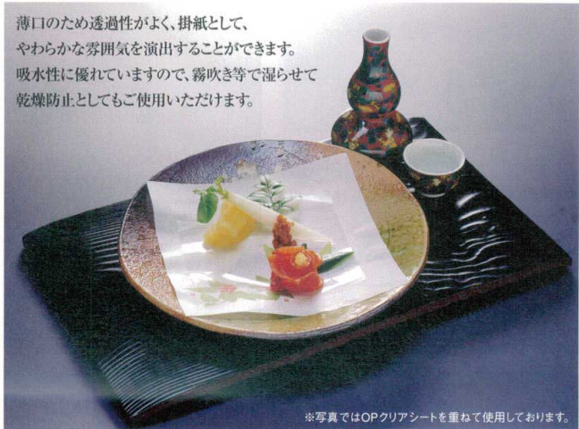
14-255-02 (65391) つくし (2月～4月)

薄口のため透過性がよく、掛紙として、 やわらかな雰囲気演出することができます。 吸水性に優れていますので、霧吹き等で湿らせて 乾燥防止としてもご使用いただけます。