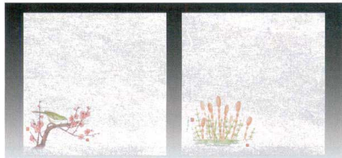
14-255-01 (65390) 梅 (1月～3月)