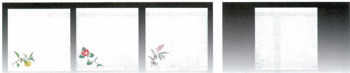
14-256-16(64778) 柚子(10月～12月) 14-256-17(64774) 椿(11月～2月) 14-256-18(64756) 南天(12月～1月) 5寸グルメ敷紙 無地 (500枚入) 14-256-19(64768) 5,000円 約15×15cm(1枚当り10円)

ご使用上の注意 | 食用色素インキを使用しておりませんので、直接お料理を盛りつける時は、必ず縁柄部分を避けてご使用ください。