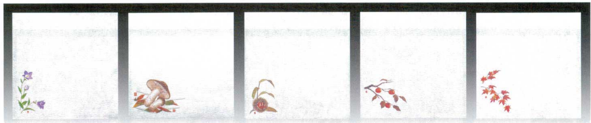
14-256-11(64776) 桔梗(8月～9月) 14-256-12(65127) 松茸(8月～10月) 14-256-13(64752) 栗(8月～10月) 14-256-14(64777) 柿(9月～11月) 14-256-15(64754) 紅葉(10月～11月)