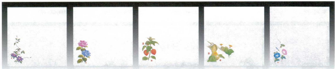
14-256-06(64412) 鉄線(5月～6月) 14-256-07(64775) 紫陽花(6月～7月) 14-256-08(65126) ほおずき(6月～8月) 14-256-09(65125) 瓢箪(6月～8月) 14-256-10(64766) 朝顔(7月～8月)