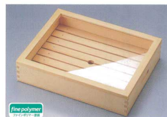
ネタ箱(小)目皿・アクリル蓋付 14-029-09 (35583) 21,300円 約34.5×27.5×H7.9cm ※内寸約32.2×25.2×H6(目皿から4.3)cm