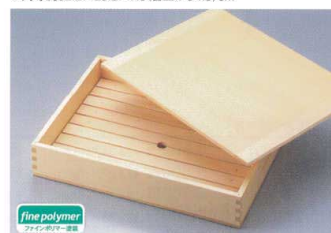
ネタ箱(中)目皿・木製蓋付 14-029-10 (35584) 21,700円 約37.5×29×H7.7cm ※内寸約35.8×27.2×H6(目皿から4.3)cm