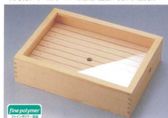
ネタ箱(大)目皿・アクリル蓋付 14-029-12 (35585) 25,600円 約39×29×H10cm ※内寸約37.2×27.2×H7.8(目皿から4)cm