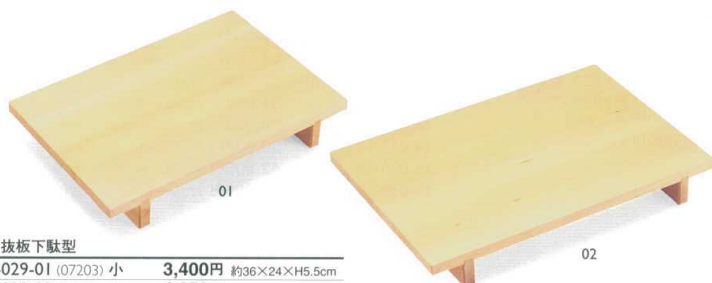
椀・抜板下駄型 14-029-01 (07203) 小 3,400円 約36×24×H5.5cm 14-029-02 (07204) 大 4,250円 約42×30×H5.5cm