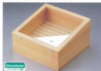
ネタ箱傾斜型 目皿・アクリル蓋付 受注 14-029-11 (35586) 27,700円 約30×29×H17(11.6)cm ※内寸約27.6×26.6×H14.6(9.3)(目皿から8.7(7.6))cm