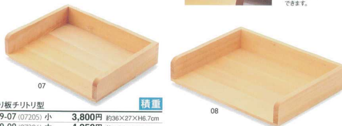
椀・作り板チリトリ型 積重 14-029-07 (07205) 小 3,800円 約36×27×H6.7cm 14-029-08 (07206) 大 4,250円 約39×30×H6.7cm