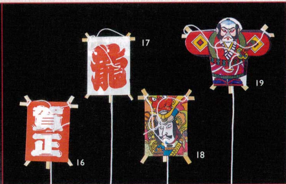
ミニ凧針金付 (100枚入)