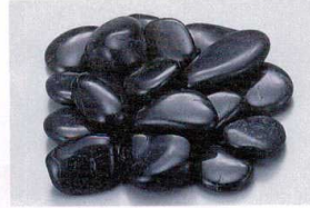
黒球石 14-314-24 (56178) 10kg入 5,000円