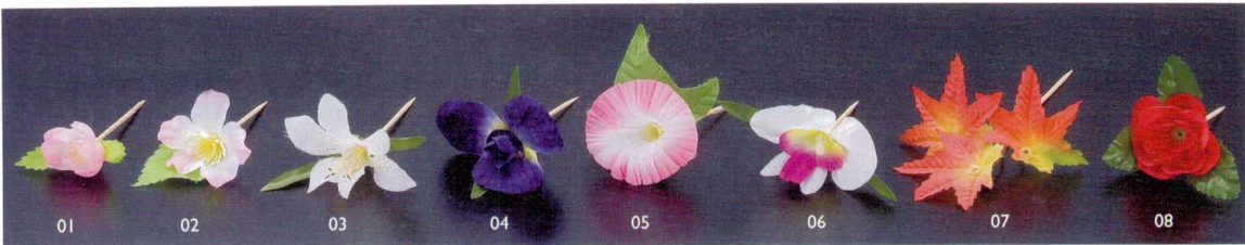
花楊子 ※花部分の材質：プラスチック(ポリエステル・ポリエチレン)