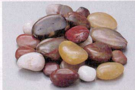
五彩石 L 14-314-20 (56176) 10kg入 5,000円