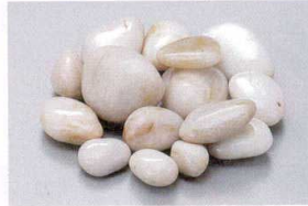
白球石 14-314-22 (56179) 10kg入 5,000円