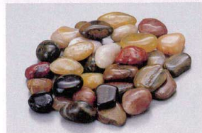
五彩石 S 14-314-18 (56177) 10kg入 5,000円