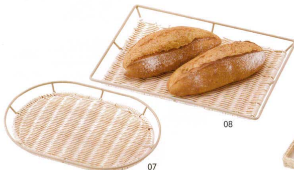
ラタントレイ ワイヤーガード付