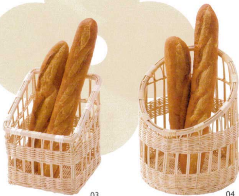
ラタンボックス スタンド型

ラタン特有の性質が焼きたてパンの水分をうまく調節してくれます。毎日使うものだからいいものを使いたい。