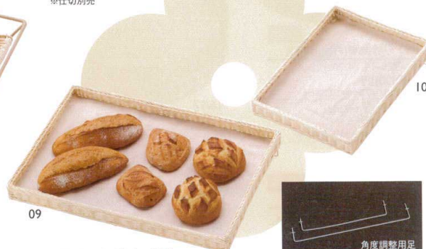
ラタントレイ ボックス浅型