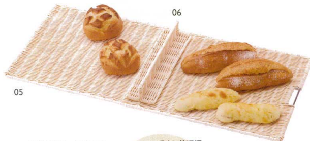
ラタントレイ フラットLL