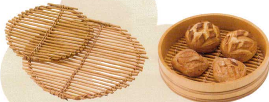
染柳 目透かしトレイ 丸

他のお店と差が出る陳列トレイです。 ※食品陳列には必ず麻布やペーパーを敷いてご使用ください。