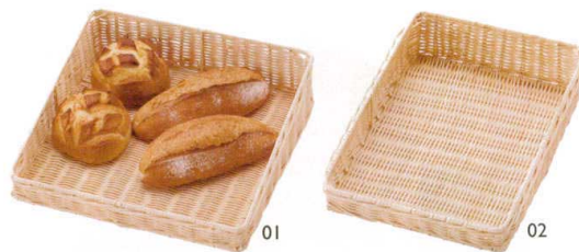
ラタンボックス スロープ