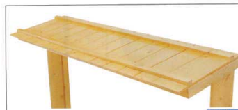
専用板屋根 受注 14-340-09 (52618) ナチュラル 18,000円 約150×46×H3cm