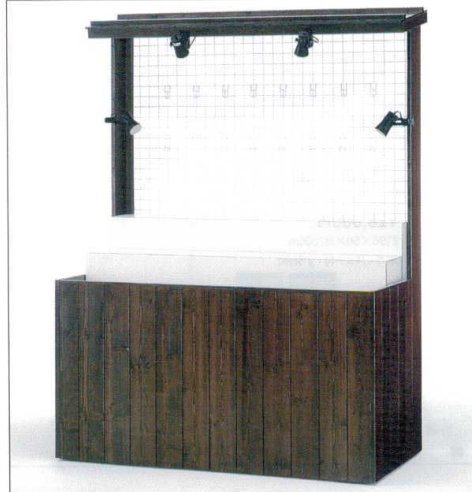
フック商品陳列タイプ(古代色) 受注 組立 運賃 屋内 14-340-02 (52611) 180,000円 本体約150×75×H200cm ※メラミン陳列台・フックは別売です。(板屋根付) ※スポットライトは市販品をご用意ください。