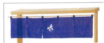
のれん 味 14-340-05 (55127) 7,500円 約150×30cm