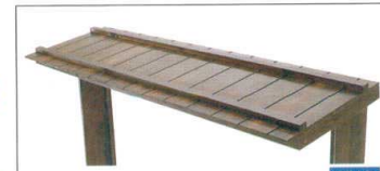
専用板屋根 受注 14-340-10 (52619) 古代色 18,000円 約150×46×H3cm