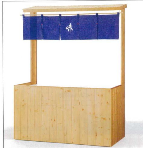
対面販売タイプ(ナチュラル) 受注 組立 運賃 屋内 14-340-03 (52612) 158,000円 本体約150×75×H200cm ※のれんは別売です。(よしず付)