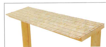
専用よしず 受注 14-340-08 (52615) 1,800円 約150×45×H0.5cm