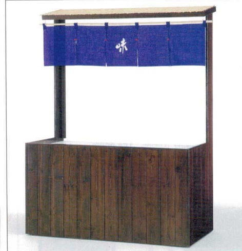
対面販売タイプ(古代色) 受注 組立 運賃 屋内 14-340-04 (52613) 158,000円 本体約150×75×H200cm ※のれんは別売です。(よしず付)

屋台風販売什器 売り場づくりは雰囲気作りから。本格的な演出で、デパ地下惣菜売場、道の駅・サービスエリアに最適。