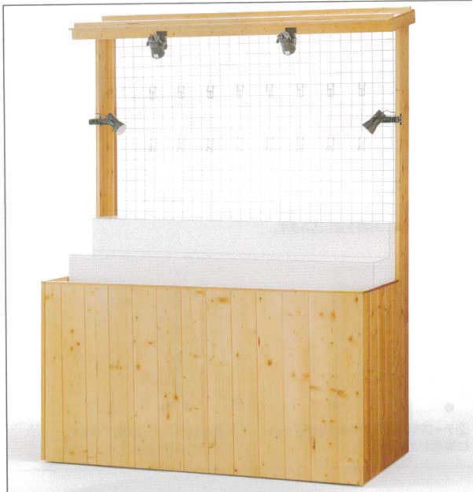
フック商品陳列タイプ(ナチュラル) 受注 組立 運賃 屋内 14-340-01 (52610) 180,000円 本体約150×75×H200cm ※メラミン陳列台・フックは別売です。(板屋根付) ※スポットライトは市販品をご用意ください。