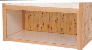
パネルショップ・ユニットショップの裏側

ユニットショップ ひのき仕様 受注 ノック 運賃 屋内 14-342-10 (55102) US-1500H 349,500円 本体約173.5×94×H210cm 天板約143×75cm ※のれん(14-342-02)別売