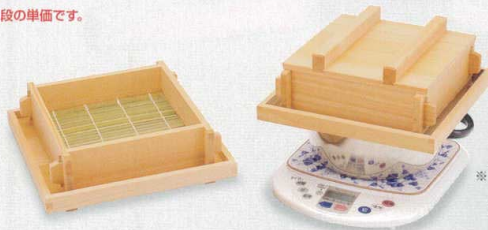
※「ステンレス外輪鍋(大)(小)」は電磁調理器に対応しています。