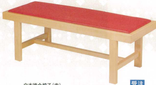
白木待合椅子(赤) 受注 14-365-01 (57223) レザー 63,000円 約120×45×H41cm