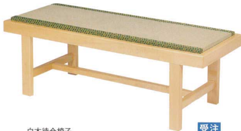
白木待合椅子 受注 14-365-05 (57222) 本畳 83,000円 約120×45×H41cm