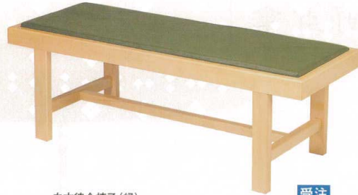
白木待合椅子(緑) 受注 14-365-02 (57224) レザー 63,000円 約120×45×H41cm