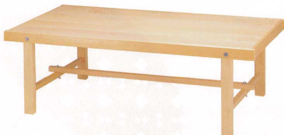
白木床机(縁台) 組立 14-365-09 (56208) 59,000円 約150×80×H48cm ※無塗装