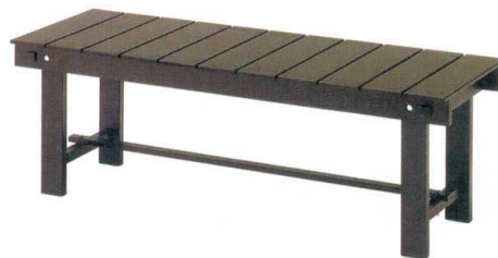
黒塗り縁台 組立 14-365-08 (57214) 29,000円 約120×40×H41cm