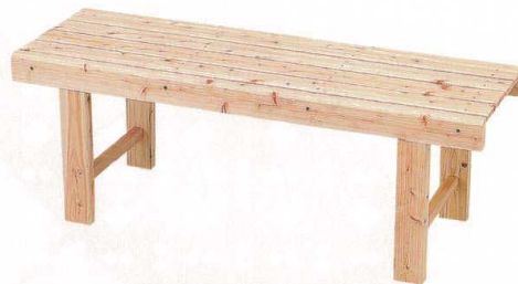
檜・縁台(小) 組立 14-365-10 (43310) 13,500円 約112×39×H41cm ※無塗装