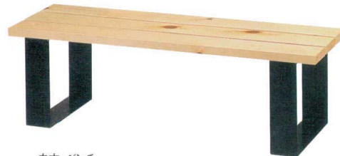
白木・ベンチ 14-365-06 (57202) 41,000円 約120×40×H41cm ※スチール脚