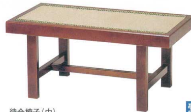
待合椅子(中) 受注 14-365-04 (57207) 64,000円 約90×45×H40cm