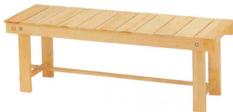
白木縁台 組立 14-365-07 (56233) 25,500円 約120×40×H41cm