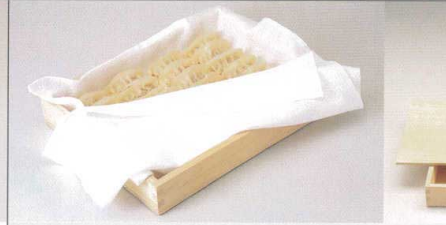
白木ギョーザバット