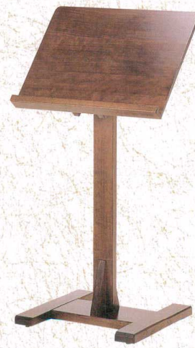
14-383-09 (50415) メニュースタンド 古代色 58,000円 約60×44×H113cm ※プレート:約60×43cm