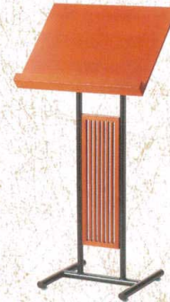
14-383-03 (50464) メニュースタンドCOMBI ナチュラル 飾り縦格子 59,000円 約56×38×H118cm ※プレート:約56×45cm