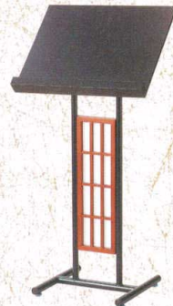
14-383-04 (50469) メニュースタンドCOMBI ブラック 飾り障子 59,000円 約56×38×H118cm ※プレート:約56×45cm ※障子:樹脂製