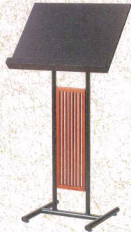
14-383-01 (50468) メニュースタンドCOMBI ブラック 飾り縦格子 59,000円 約56×38×H118cm ※プレート:約56×45cm