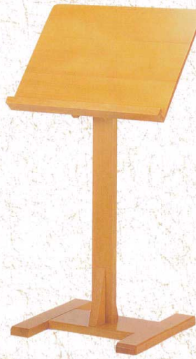
14-383-08 (50416) メニュースタンド ナチュラル 58,000円 約60×44×H113cm ※プレート:約60×43cm