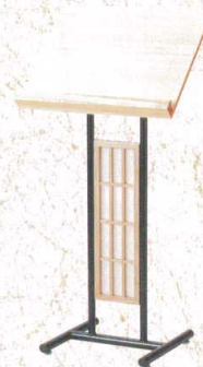
14-383-05 (50467) メニュースタンドCOMBI クリア 飾り障子 59,000円 約56×38×H118cm ※プレート:約56×45cm ※障子:樹脂製