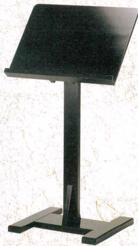
14-383-07 (50417) メニュースタンド 黒塗 58,000円 約60×44×H113cm ※プレート:約60×43cm