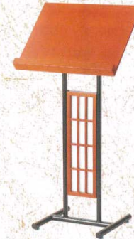
14-383-06 (50465) メニュースタンドCOMBI ナチュラル 飾り障子 59,000円 約56×38×H118cm ※プレート:約56×45cm ※障子:樹脂製