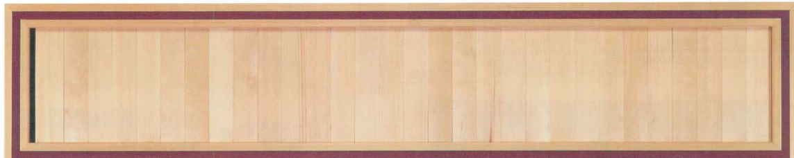
ラインメニュー額 (30枚入)