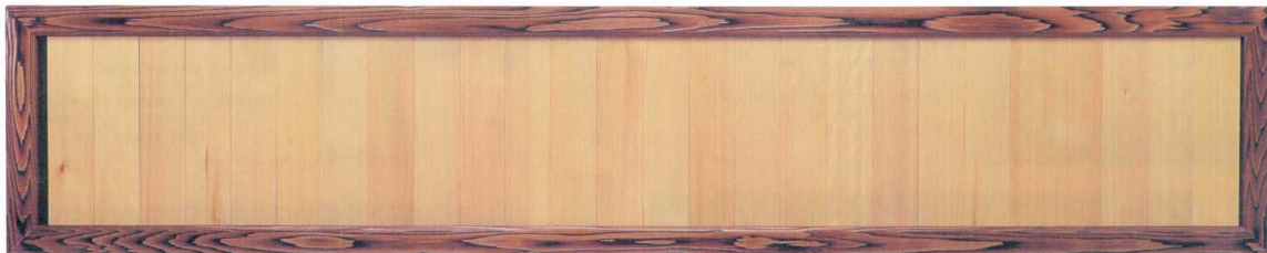
ネズコメニュー額 (27枚入)