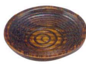
4.2寸口口筋茶托(黒茶) 14-052-07 (16380) 680円 約φ12.3×H2.5cm