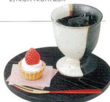
焼樺・ティートレイ丸型(大) 14-052-23 (16452) 2,700円 約φ18.5×H1.8cm