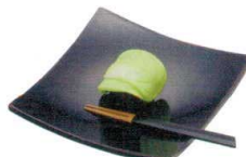
溜塗 吹上角銘々皿 14-052-18 (32293) 1,500円 約14.8×14.8×H2cm