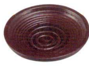
4.2寸口口筋茶托(根来) 14-052-06 (16382) 800円 約φ12.3×H2.5cm