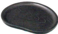
樺・ティートレイ(ビーンズ) 14-052-25 (16451) 1,800円 約20×16×H1.5cm