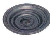
4.0象谷茶托 14-052-08 (16406) 1,000円 約φ12×H1.7cm