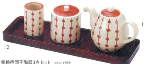
12 赤絵串団子陶器3点セット ※トレイ別売 14-059-11 (16160) 5,550円 カスター盆(小) 14-059-12 (15114) 1,500円 約23.5×7.8×H1.4cm/内寸約22.2×7.2cm