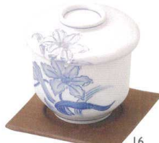
16 焼杉茶碗蒸台 14-059-16 (08605) 220円 約10×10×H0.8cm/内径約φ5.8cm ※敷板のみ ※陶器に合わせて別注サイズ承ります。