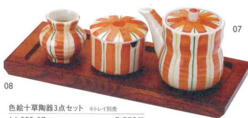
08 色絵十草陶器3点セット ※トレイ別売 14-059-07 (16172) 5,550円 ミニトレイ(大) (ハイブラウン) 14-059-08 (15112) 1,800円 約25×10.5×H1.5cm/内寸約21.7×8.5cm