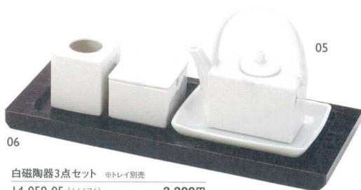
06 白磁陶器3点セット ※トレイ別売 14-059-05 (16176) 3,300円 ミニトレイ(大) (ハイブラック) 14-059-06 (15166) 1,700円 約25×10.5×H1.5cm/内寸約21.7×8.5cm