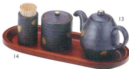
14 南蛮金彩陶器3点セット ※トレイ別売 14-059-13 (16164) 5,550円 楕円トレイ(大) 14-059-14 (15315) 1,600円 約22.5×9.3×H2cm/内寸約21.3×8cm