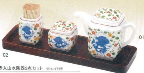
02 赤入山水陶器3点セット ※トレイ別売 14-059-01 (16320) 4,350円 カスター盆(小) 14-059-02 (15114) 1,500円 約23.5×7.8×H1.4cm/内寸約22.2×7.2cm