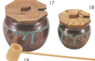
17 陶器タレ入(焼杉木蓋付) 14-059-17 (16100) 大 1,250円 陶器サイズ約φ11×H8.5cm/蓋約φ10cm