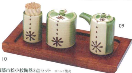
10 織部市松小紋陶器3点セット ※トレイ別売 14-059-09 (16168) 5,550円 ミニトレイ(小) (ハイブラウン) 14-059-10 (15111) 1,700円 約21×10.5×H1.5cm/内寸約17.5×8.5cm