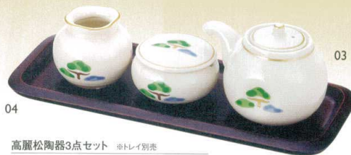
03 高麗松陶器3点セット ※トレイ別売 14-059-03 (16319) 4,050円 長角カスター(大) 14-059-04 (15318) 1,600円 約25.5×11×H1.5cm/内寸約23.5×9.3cm