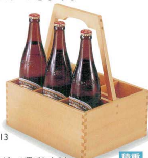
13 白木ビール運び(6本入) 積重 14-067-13 (17318) 12,000円 約28×21.6×H31.2cm/1樹内寸約8.5×8.5×H11cm ※大瓶も入ります。