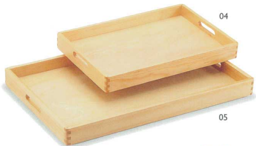
04 05 白木脇取盆 積重 14-067-04 (17103) 小 8,000円 約45×30×H5cm 14-067-05 (17104) 大 11,500円 約60×39×H5cm