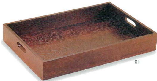
01 栓・料理運び盆 14-067-01 (17210) 12,000円 約60.3×40.3×H9cm