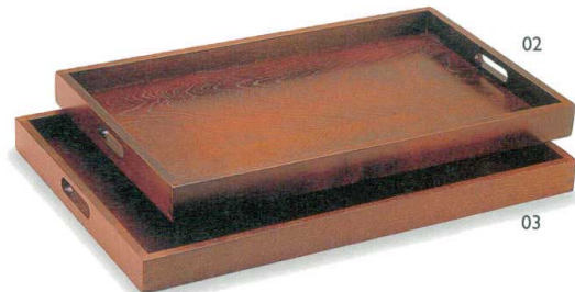
02 03 栓・脇取盆 14-067-02 (17209) 小 8,100円 約57.3×35.4×H4.5cm 14-067-03 (17208) 大 8,500円 約60.3×39×H4.5cm