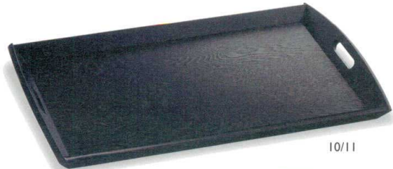
10/11 新型脇取盆 黒 積重 14-067-10 (17197) 小 13,800円 約51×32×H3.5cm 14-067-11 (17198) 大 15,800円 約64×40×H3.5cm

大勢のお客様のおもてなしに最適。 お銚子やビールを安全に何本も運ぶことができます。