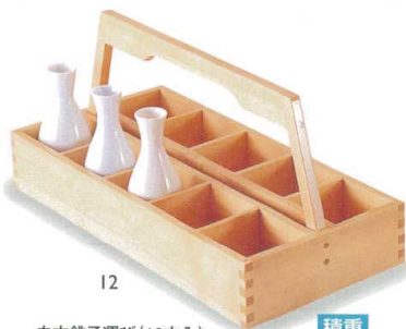
12 白木銚子運び(10本入) 積重 14-067-12 (17317) 12,000円 約41.4×20×H23.5cm/1樹内寸約7.5×7.5×H5.5cm

大勢のお客様のおもてなしに最適。 お銚子やビールを安全に何本も運ぶことができます。