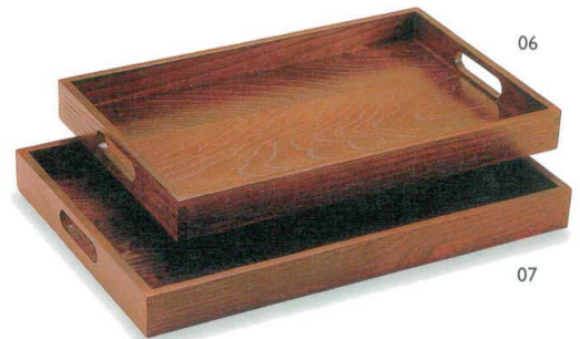
06 07 栓・ミニ脇取盆 14-067-06 (17212) 小 5,600円 約42.3×27.2×H4.3cm 14-067-07 (17211) 大 5,800円 約45.3×30×H4.3cm