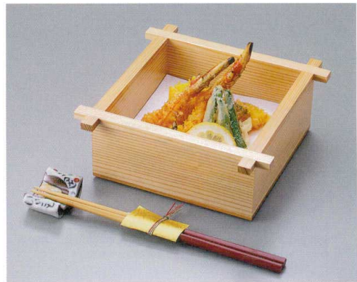
14-074-06 (27409) 木曾杉・井桁料理箱 4,100円 約18×18×H6.8cm/内寸約13.3×13.3×H6.1cm