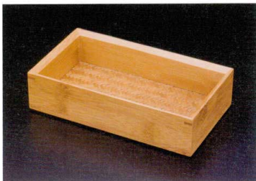
14-074-01 (27197) 積重 スス竹・網代底料理箱 3,100円 約19.5×11×H5cm/内寸約18×9.5×H3.9cm ※竹製