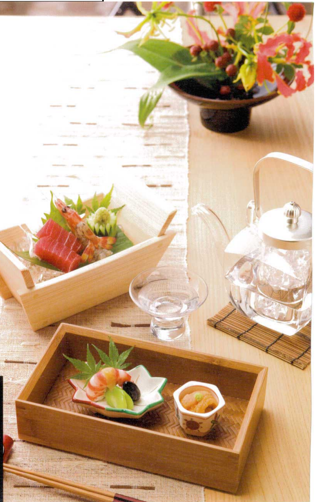
ひのき・貴船料理箱(目皿付)