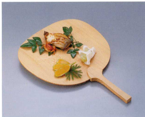
14-074-05 (32106) 木曾杉・うちわ皿(八寸皿) 8,500円 fine polymer 約23×32.5×H2cm ※ファインポリマー塗装(P115参照)