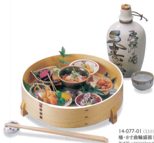
14-077-01 (33310) 積重 檜・8寸曲輪盛器(足付) 6,800円 外寸約φ24×H7cm/内寸約φ23×H4.5cm ※陶器別売