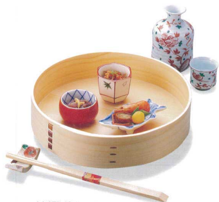
14-077-13 (27406) 檜・8寸曲輪盛器(足ナシ) 5,600円 約φ24×H5.3cm/内寸約φ23×H4.5cm ※陶器別売