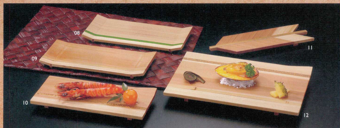
14-077-08 (32246) 杉・若竹吹上皿 2,900円 約23×10.5×H1.7cm 14-077-09 (32244) 杉・呉竹吹上皿 2,900円 約23×10.5×H1.7cm 14-077-10 (32243) 杉・呉竹前菜皿 3,100円 約28×10.5×H1.8cm 14-077-11 (32245) 杉・呉竹矢型皿 3,200円 約24×7.7×H1.4cm 14-077-12 (32241) 杉・呉竹八寸皿(隅折) 4,800円 約27.2×18×H2.5cm