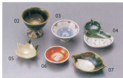
14-077-02 (26653) 織部十草高台珍珠入 1,200円 約φ7.7×H6.2cm 14-077-03 (26551) 手描青地唐津福珍珠入 1,100円 約φ7.5×H3.5cm 14-077-04 (19456) 織部草文瓢小皿 900円 約11.5×8×H2.3cm 14-077-05 (26333) もみじ型珍珠入(織部) 480円 約7×6×H3.5cm 14-077-06 (26654) 朱巻棒豆皿 680円 約φ6.3×H2.3cm 14-077-07 (26655) 織部椿小皿 880円 約10×7.9×H1.9cm