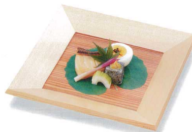
14-077-17 (38566) 受注 杉・桧合わせ四方皿 3,850円 約22.5×22.5×H2.7cm