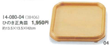
14-080-04 (38406) ひのき正角皿 1,950円 約13.5×13.5×H2cm