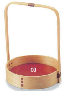
14-080-03 (33308) 朱塗り板 700円 約φ13.8cm ※盛器別売