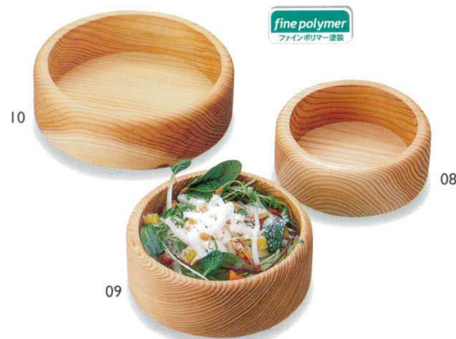
杉・クリア サラダ小鉢(ファインポリマー)