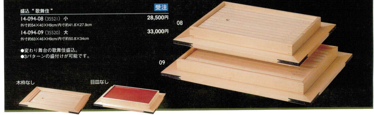
盛込“歌舞伎” 14-094-08 (35521) 小 28,500円 外寸約54×40×H9cm/内寸約41.8×27.9cm 14-094-09 (35520) 大 33,000円 外寸約63×46×H9cm/内寸約50.8×34cm