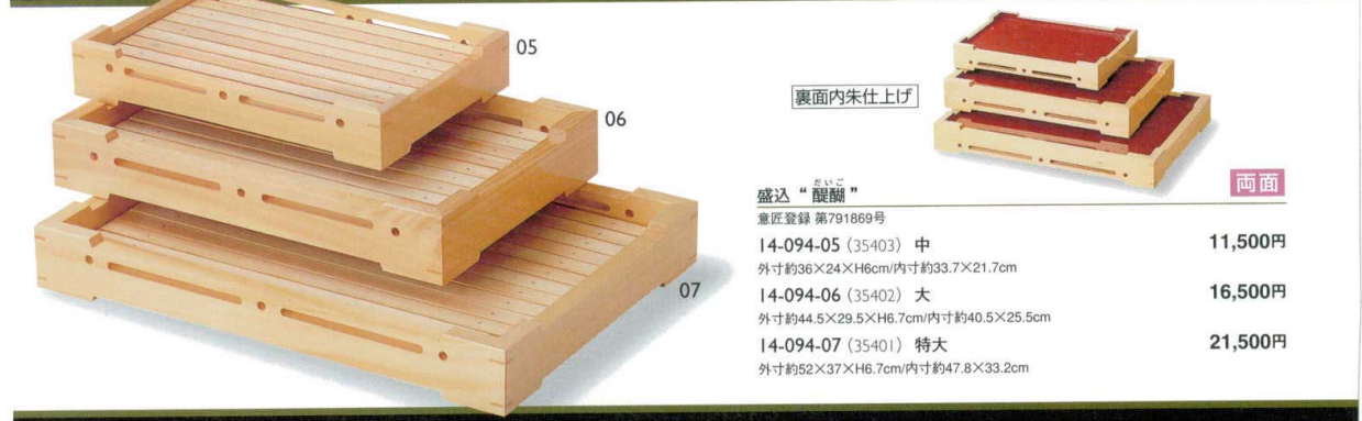
盛込“醍醐” 意匠登録 第791869号 14-094-05 (35403) 中 11,500円 外寸約36×24×H6cm/内寸約33.7×21.7cm 14-094-06 (35402) 大 16,500円 外寸約44.5×29.5×H6.7cm/内寸約40.5×25.5cm 14-094-07 (35401) 特大 21,500円 外寸約52×37×H6.7cm/内寸約47.8×33.2cm