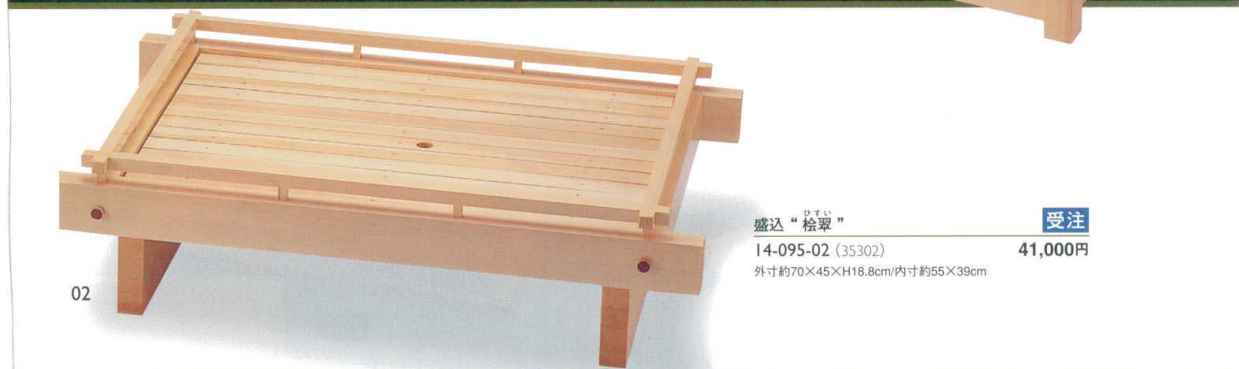
盛込 “松翠” 14-095-02 (35302) 受注 41,000円 外寸約70×45×H18.8cm/内寸約55×39cm