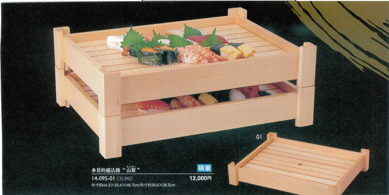
多目的盛込器 “山翠” 14-095-01 (35390) 積重 12,000円 外寸約44.3×33.4×H8.7cm/内寸約39.6×28.5cm