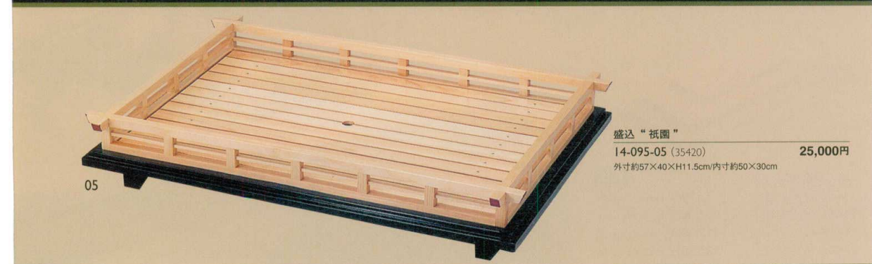
盛込 “祇園” 14-095-05 (35420) 受注 25,000円 外寸約57×40×H11.5cm/内寸約50×30cm