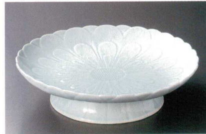
153-46-692 青白磁菊彫高台盛皿(有田焼) 35,000円 36.5×9.5cm 16715691