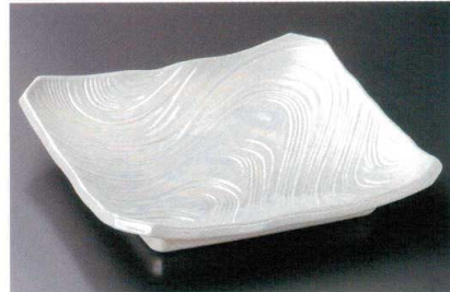
153-40-692 ラスター渦盛皿(有田焼) 11,000円 31.5×31.5×6cm 1×6入 16707691