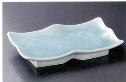
153-37-692 エビ青海波彫盛皿(有田焼) 7,500円 33×20×5.5cm 3入 16703691