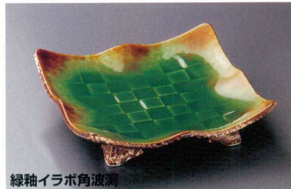
緑釉イラボ角波洞