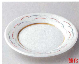
175-16-752 銀彩武蔵野6.5丸皿 1,150円 19.5×2.1cm 16411751