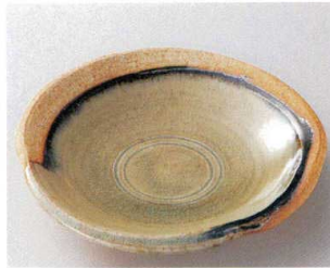
175-2-792 まりも6.0丸皿 1,600円 18×17.6×3.5cm 16302791