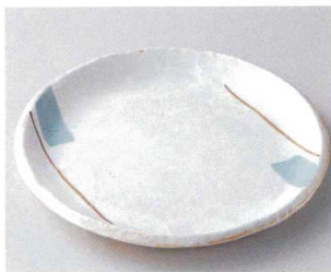
175-5-732 筆あそび7.0丸皿 1,550円 20.7×2.5cm 16310731