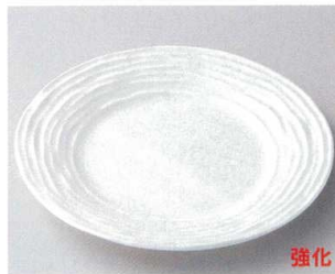
175-6-202 NBヴェブ21cm丸皿 1,450円 20.7×2.1cm 58803201