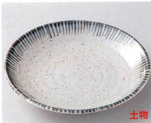
175-1-702 細十草6.0丸皿 1,600円 18×3cm 16303701