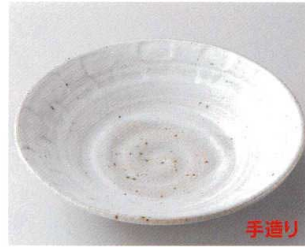
175-4-682 カスミ刷毛目和皿 1,570円 20×4.5cm 16305681