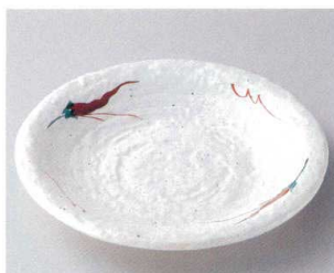
175-13-752 粉引唐がらし19.8cm丸皿 1,300円 19.7×2.5cm 16416751