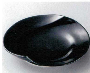
175-10-552 ゆず黒ニツ押前菜皿 1,360円 19.5×17.5×4.5cm 24904551