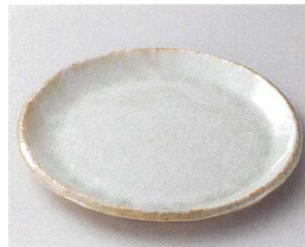
175-12-712 白雲7.0丸皿 1,300円 21×2cm 16404711