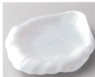
175-20-552 青磁芭蕉葉皿(大) 1,100円 20×16.5×3.6cm 17520552 175-21-552 青磁芭蕉葉皿(小) 900円 17×14×3.3cm 17521552