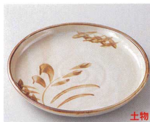
175-14-732 乾山風芦絵6.0丸皿 1,200円 15.8×2.6cm 17514732