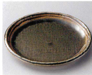
175-8-792 織部ライン7.0丸皿 1,450円 20.4×2.1cm 17508792