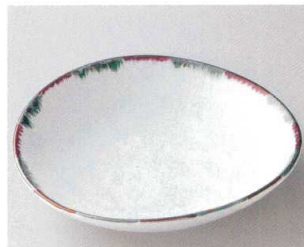
175-11-752 ラスター彩20cm変型皿 1,300円 19.9×18.9×4.4cm 17511752