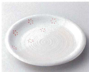
175-9-792 粉引小紋6.5丸皿 1,400円 19.3×2.5cm 16405791