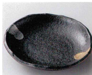
175-15-792 南蛮金銀6.0丸皿 1,200円 17×15.5×3cm 16409791