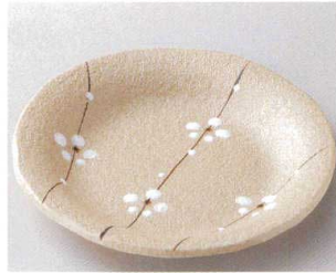
175-3-792 春一番6.0丸皿 1,600円 18.2×2.5cm 16220791