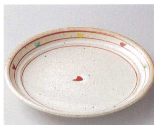
175-18-202 粉引千鳥7.0皿 1,000円 20.7×3cm 15821201