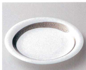
175-19-012 銀彩刷毛6.0皿 1,240円 19.5×2cm 17519012